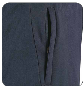
boční kapsa bočné vrecko side pocket boczna kieszeń