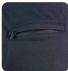
zadní kapsa zadné vrecko back pocket tylna kieszeń